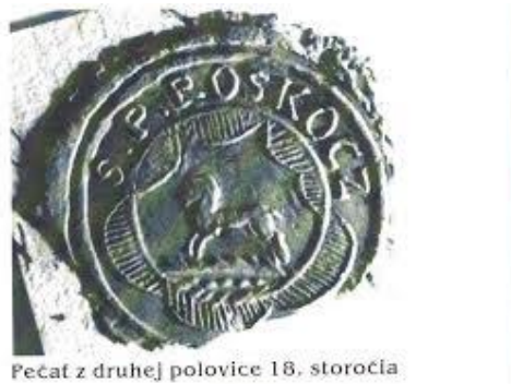
Pečať z druhej polovice 18. storočia

Obecná pečať pochádza z druhej polovice 18. storočia. Odtlačok nedatovaného typára je uložený v Uhorskom krajinskom archíve v Budapešti (MOL Budapest, V-5, Altenburger Pesétgyujteménye). Na pečati s kruhopolisom S.P. ROSKOCZ (Sigillum Possessionis Roskócz) je vyobrazený na pažiti kôň. Táto pečať sa stala východiskom pri vypracovaní a tvorbe obecného erbu.