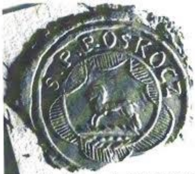
Pečať z druhej polovice 18. storočia

Obecná pečať pochádza z druhej polovice 18. storočia. Odtlačok nedatovaného typára je uložený v Uhorskom krajinskom archíve v Budapešti (MOL Budapest, V-5, Altenburger Pesétgyujteménye). Na pečati s kruhopisom S.P. ROSKOCZ (Sigillum Possessionis Roskócz Pečať obce Roškovec) je vyobrazený na pažiti kôň. Táto pečať sa stala východiskom pri vypracovaní a tvorbe obecného erbu